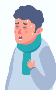
FALTA DE AIRE